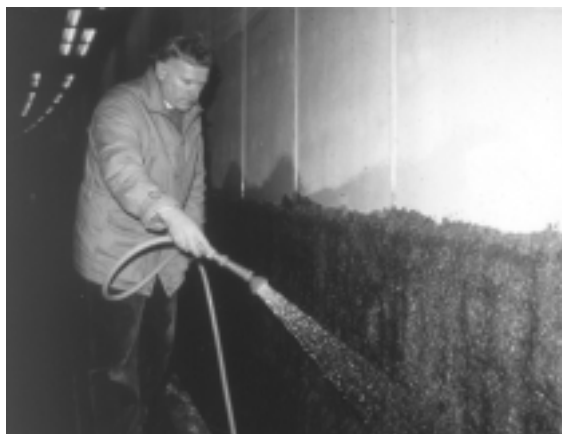
Fig. 11. Elektro-kemisk chloridudtrækning, kan vare op til 8 uger (det afhænger af betonens chloridindhold og tæthed). Den påsprøjtede cellulosemasse må ikke under processen udtørre og skal derfor vådholdes.

Elektro-kemisk udtrækning af chlorid fra beton blev først anvendt i USA i 1976. Der var imidlertid så mange