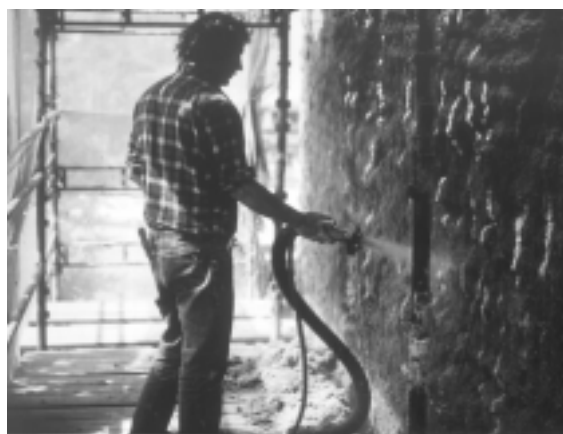
Fig. 10. Påsprøjtning af elektrolytvædet cellulosemasse er en simpel proces. Dog kræver påsprøjtning beskyttelse mod kraftig vind. Dette kan fx være aktuelt ved elektro-kemisk realkaliseret af boligbyggeri i flere etager.

Udtrækning af chlorider fra beton er teoretisk set ret simpel. Chlorider er ioner med negativ ladning. Beton er porøs, og denne porøsitet er mere eller mindre fyldt med fugt. De negativt ladede chloridioner er