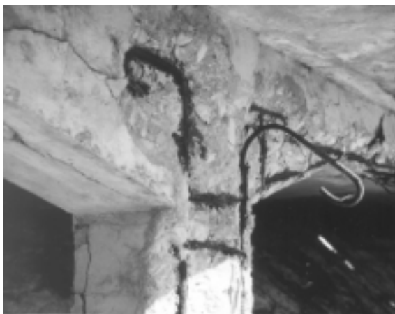
Fig. 9. Korrosion af armering som følge af chloridangreb kan på kort tid skade armeringen således, at borthugning og udskiftning af beton og armering bliver mere aktuell end renovering med elektro-kemisk chloridudtrækning.

vise sig som et vandret bånd i facaden. Dette vil dog ikke altid harmonerer med bygningens arkitektur.