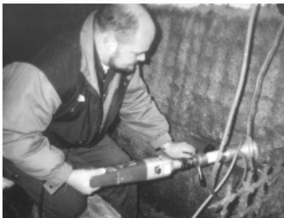
Fig. 12. Slutkontrol med den opnåede realkalisering eller chloridudtrækning sker ved analyse af udborede kerner fra konstruktionen. Det sker ved prøvning med phenolphthalein eller bestemmelse af det opnåede chloridprofil.

delaminering af beton. Det er meget vigtigt for den rette renovering at det også konstateres, om betonen lider af andre "betonsygdomme". Er det tilfældet, skal renoveringen rette sig derefter.