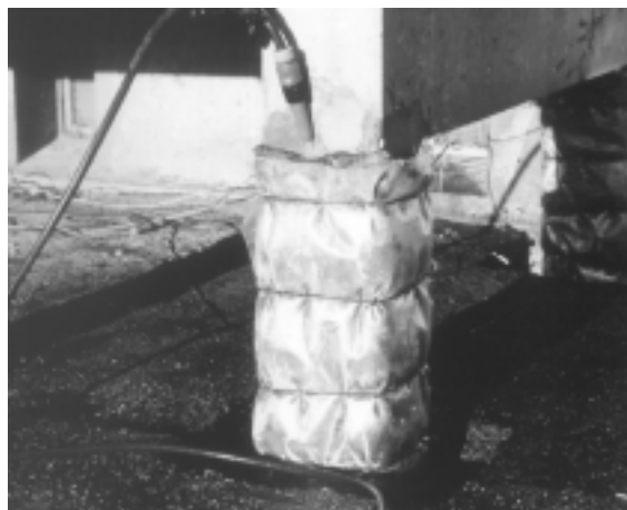
Fig. 8. Søjler, der skal realkaliseres eller afsaltes (chloridudtrækning), omvikles med gennemvædet tekstil (elektrolyt), hvori anoden placeres.

Andre muligheder for at renovere facaden er at skære tåen bort og indlægge en udfyldning, der vil