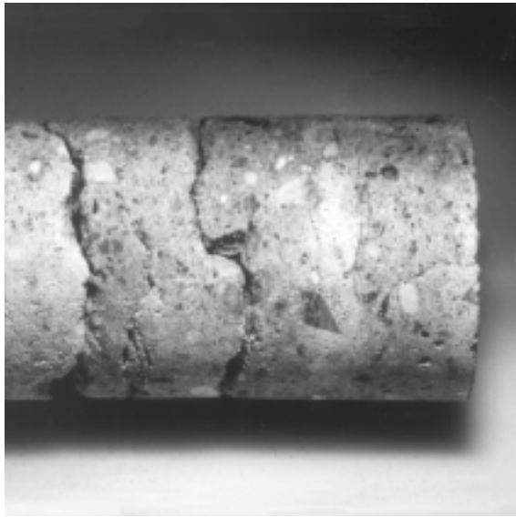
Fig. 5. Chlorid migrerer gennem betons overfladelag ved elektro-kemisk afsaltning. Er overfladelaget delamineret, som vist på borekernen, kan chlorid ikke passere revnerne. Delaminering kan findes ved impact-echo og borthugges.

Derved genvinder armeringen sin passivitet, dvs. at armeringen nu er beskyttet mod korrosion som følge af carbonatisering. Disse basiske zoner breder sig stort set koncentrisk ud fra armeringsstængerne.