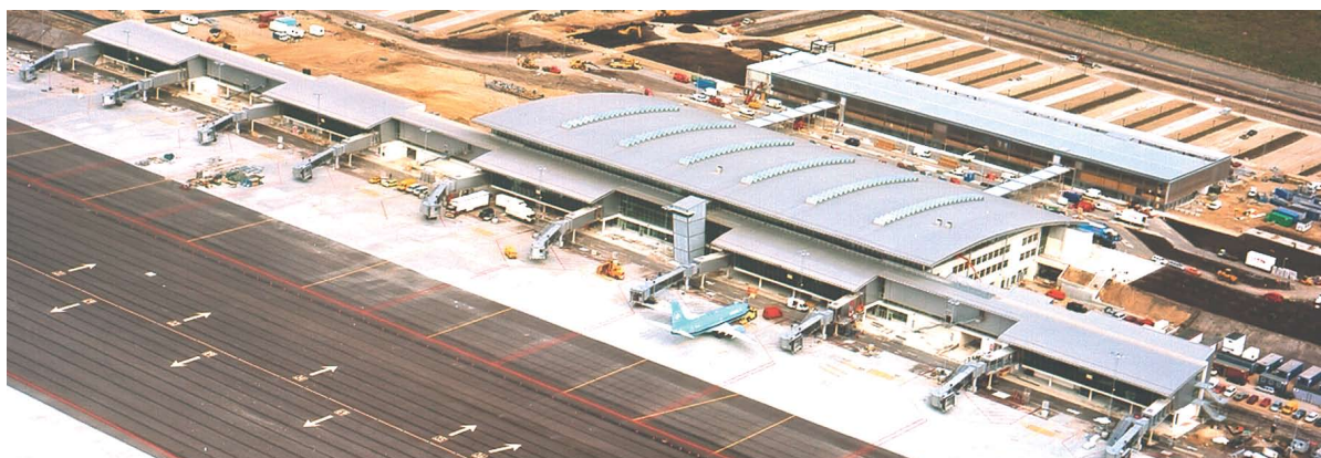
Tvangsbuede baner, specialprofil AF65/420, længder op til 86 m og profil 65/400 stucco-platteret. Billund Airport.

AE Vægkassetter og -paneler. AE Facadekassetter og -paneler.