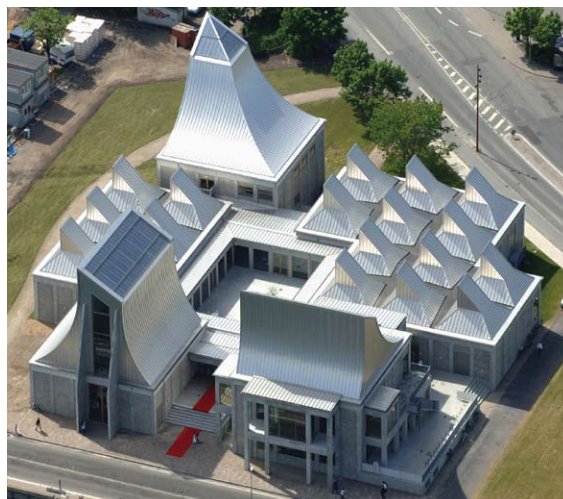
Skulpturelle tagformer beklædt med Kalzip alu-tagbaner med stucco-platteret overflade. Utzon Center, Aalborg.

* Anvendes på trædefast underlag eller til lodret facade.