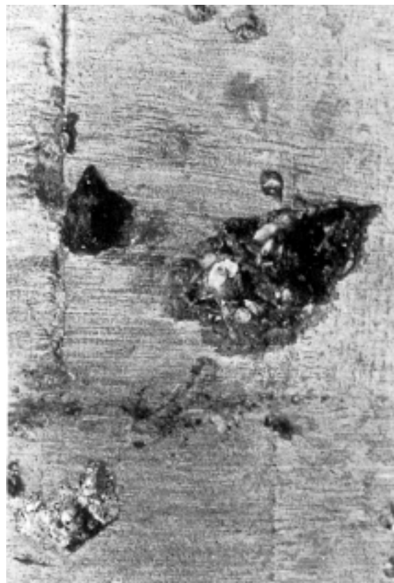
Eksempel III. Betongulv nedbrudt på grund af urenheder i tilslaget.