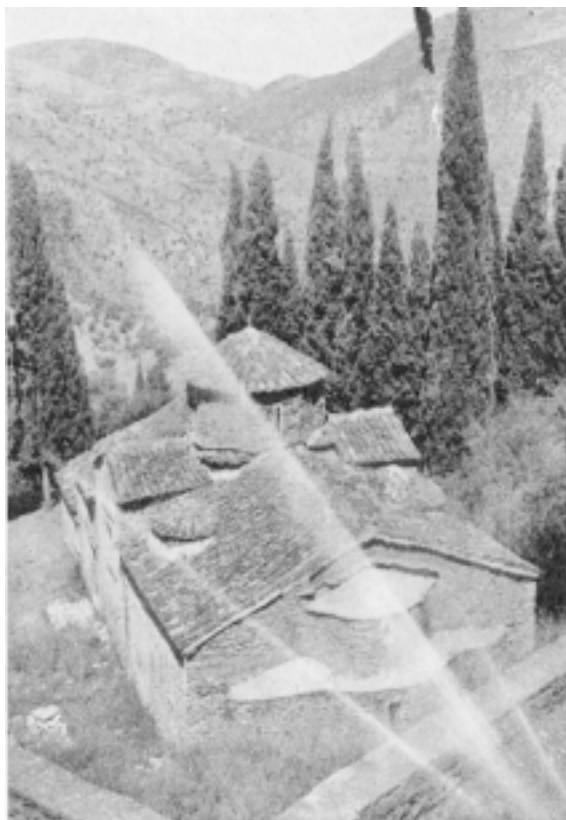
Fig. 25. Uretoucheret Kopi med Følgerne af Fejl i Apparatet Agrios Nikolaos, harytania, Grækenland).