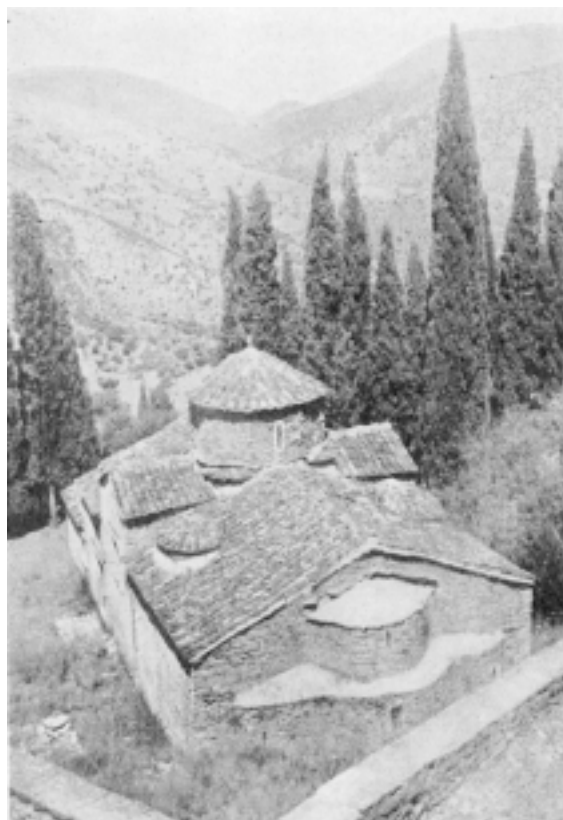
Fig. 26. Retoucheret Kopi of samme Billede som Fig. 25, (fot. Forf.).