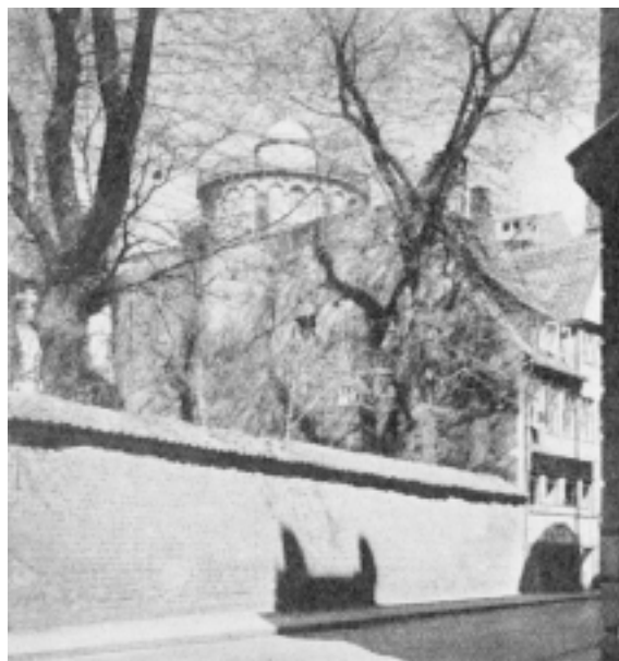
Fig. 4L Rundetaarn set fra Skindergade.

Billedet Fig. 24 er et af den Slags Billeder. som der kun meget sjældent er Lejlighed til at tage; der kan gaa Aar imellem hvis det falder ind med daarligt Vejr i de Par Dage om Aaret, hvor Knopperne kan ses tydeligt paa Billedet og dog ikke spærrer for Synet af Taarnet. Dette Billede gik det saadan, at den højst usædvanlige Skygge paa den gamle Mur, tilsyneladende Skyggen af en Kæmpe-