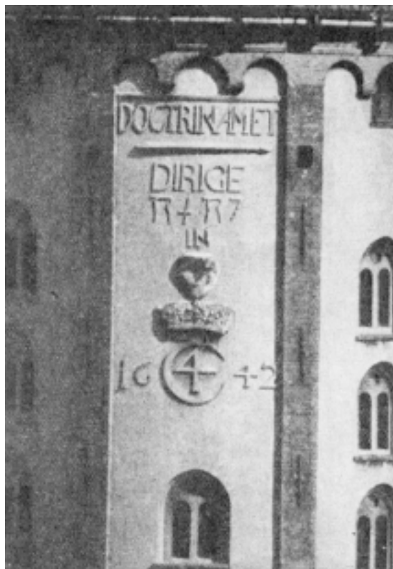
Fig. 23. Forstørret Detalje af Fig. 22.

Apparatet indstilledes paa et Felt saaledes, at dettes Snore paa alle fire Sider saas i samme Afstand fra Billedkanten paa Matskiven; et Lod ophængtes i Stativets Midtpunkt, og dets Plads i Feltet indførtes paa stift Maal. Selve Fotograferingen, 20 Optagelser, forløb derefter ganske exercitismæssigt. Den sidste Del af dem formede sig som et rasende Kapløb med Skyggerne af nogle Træer, der, efterhaanden som Solen sank, begyndte at strække sig ind over Mosaikken. En særlig Forholdsregel maatte tages, dels paa Grund af det voldsomme Lys, dels fordi Mosaikken var støvet i Farverne af at have været dækket af Jord i et Par Tusind Aar. Lige inden hver Exponering maatte hvert Felt tørres over med en vaad Svamp, saa hver enkelt Stift traadte klart frem; dog maatte ingen af dem være rigtig vaade, for saa kom der Solblink.